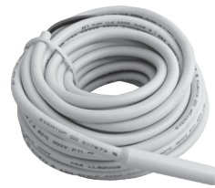
Capteur de plancher