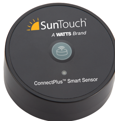
Sensor inteligente ConnectPlus

Esta ficha técnica no está diseñada para proporcionar instrucciones completas de instalación o información de seguridad. Para evitar daños a la propiedad o lesiones, consulte el manual de instalación completo y la información de seguridad del producto que se proporciona con el producto.